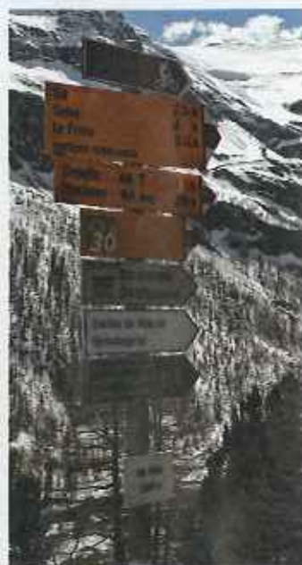
Skiltningen på vandrøuterne er omhyggelig. Her er angivet, hvor lang tid det tager at gå til de næste destinationer. Endvidere kan man se den præcise højde på det sted, man befinder sig.

ny vinkel, og undrer os endnu en gang over, at noget kan være så smukt.