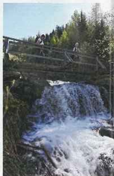
Vand kommer brusende ned fra bjergsiderne. Det er, som om blikket bliver holdt fast, når man er begyndt at kigge på det.

let har givet os med til turen. Man kan også komme rundt i dalen med det røde tog, der bragte os hertil. Og næste dag kører vi til stationen Bernina Diavolezzai, hvor vi i gondolbane kører op i 2.978 meters højde. Solen brager ned, og folk sidder i liggestole i sneen og nyder den. Vi spiser frokost udenfor på restauranten deroppe, ser bjergtinderne fra en