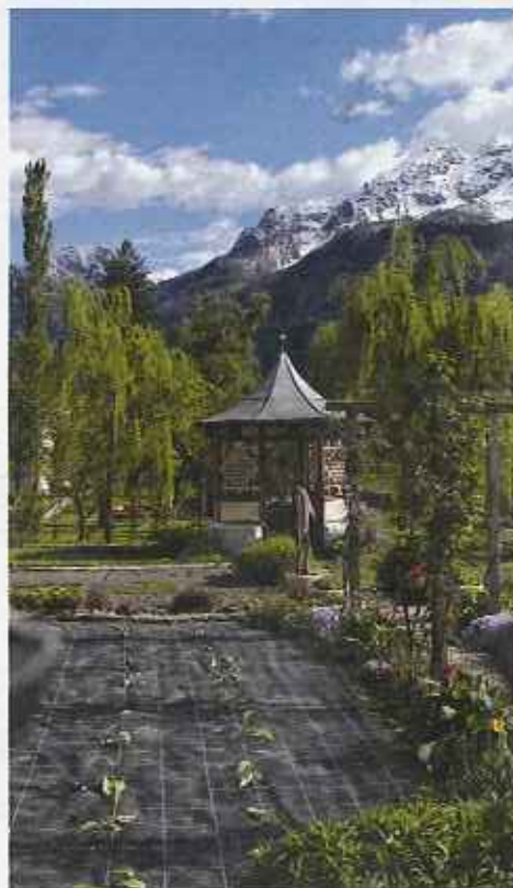
Der er malerisk i Poschiavo med kirketårne, blomster og små urtehaver.